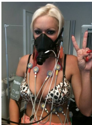
Vor der Reise in die Vergangenheit ging's zum ärztlichen Check.