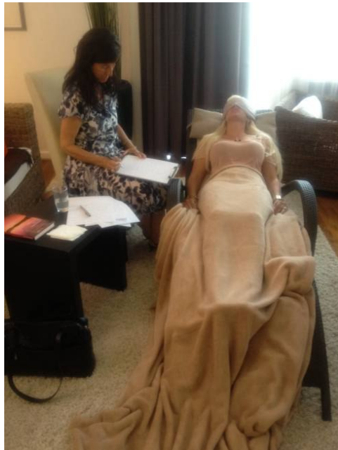
Die Schweizerin versetzt den Fernsehstar in Trance.